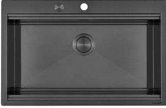
RIVA 750 GUN METAL N034 F56